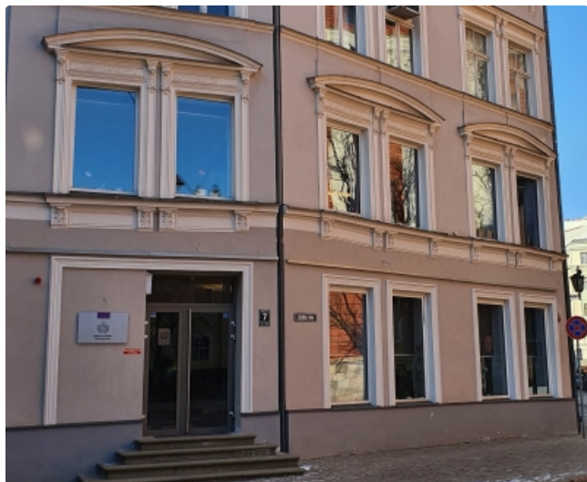
Izglītības kvalitātes valsts dienesta birojs Rīgā, Smilšu ielā 7

Izglītības kvalitātes valsts dienesta birojs Rēzeknē: